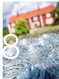
Följ med till ljuvliga Gröngölsmåla och upptäck Bandinis grossistföretag.