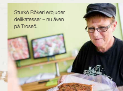
Sturkö Rökeri erbjuder delikatesser – nu även på Trossö.